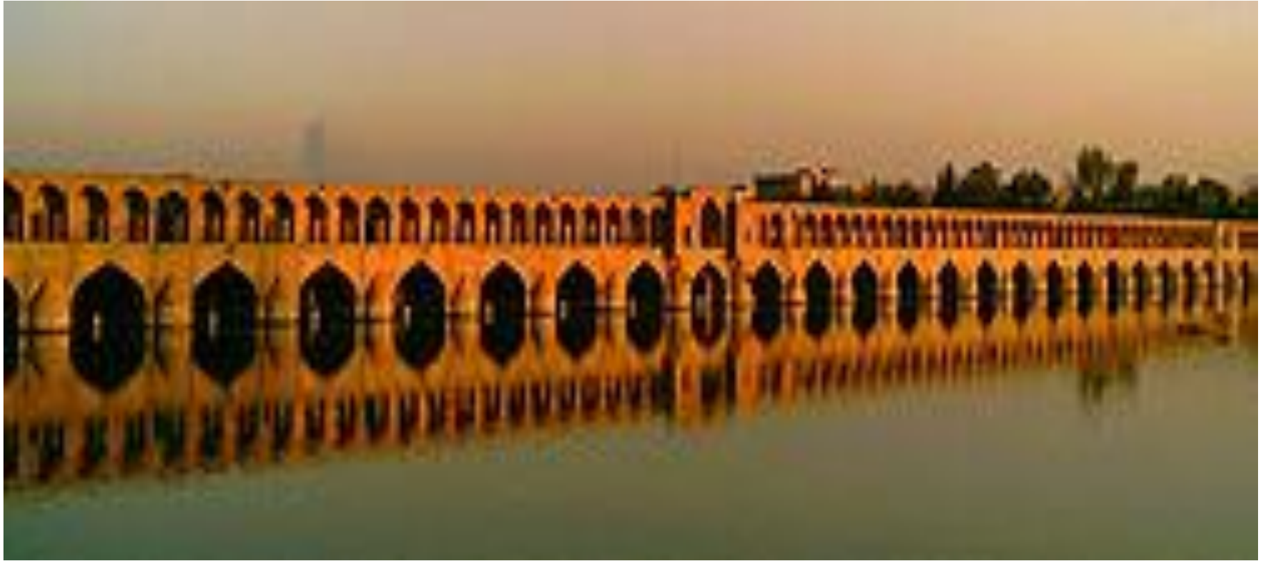
سی و سه پل